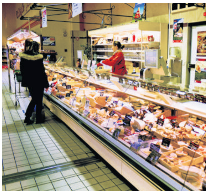
Les achats effectués par les Suisses dans les zones frontalières péjorent clairement les perspectives d'embauche dans le secteur commerce, selon Manpower. PASCAL FRAUTSCHI

Sur les sept régions sondées, trois présentent des perspectives de recrutement positives (Espace