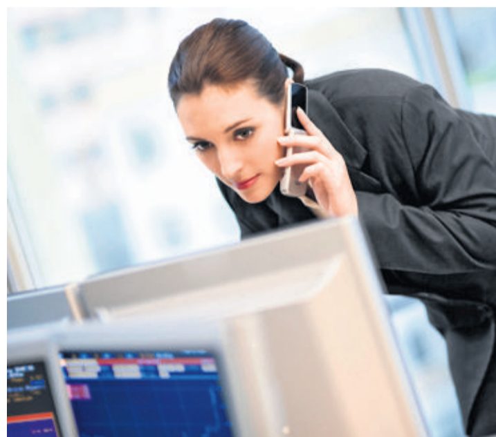
Il existe des corrélations positives entre l'évolution du chiffre d'affaires, la rentabilité et le pourcentage de femmes LD

Les premiers résultats montrent qu'il y a de grandes disparités entre pays s'agissant du nombre moyen de femmes dans les banques. Ainsi, le Canada est l'Etat où les établissements financiers sont les plus féminisés