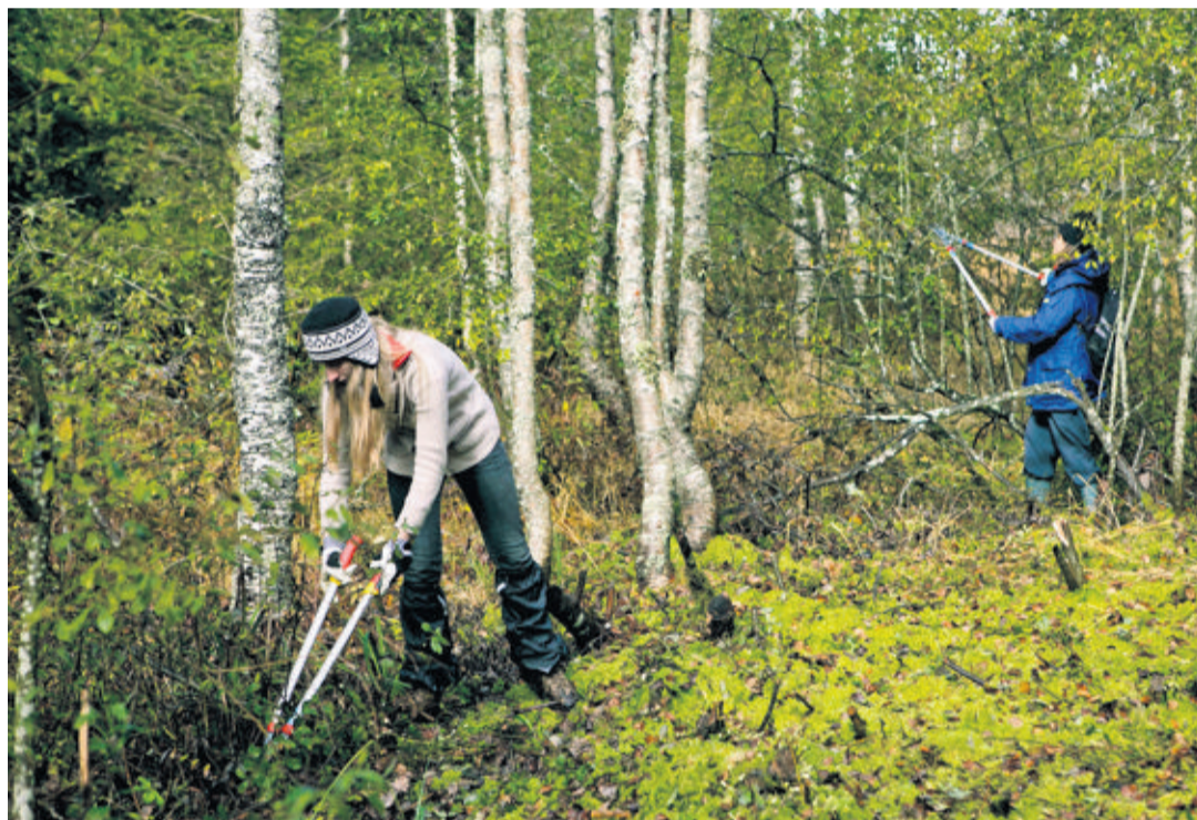
Deux bénévoles à l'œuvre en octobre dernier dans le cadre de la Fondation Bergwaldprojekt, à Blonay.

L'OFS révèle qu'en moyenne, ces personnes consacrent 13,7 heures par mois pour le bénévolat organisé et 15,5 heures pour le bénévolat informel. Le total d'heures de travail bénévole pour 2010 est es-